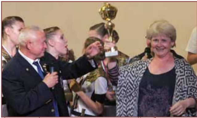
Фитнес-фестиваль, посвященный юбилею лагеря «Горный» страница 4-5