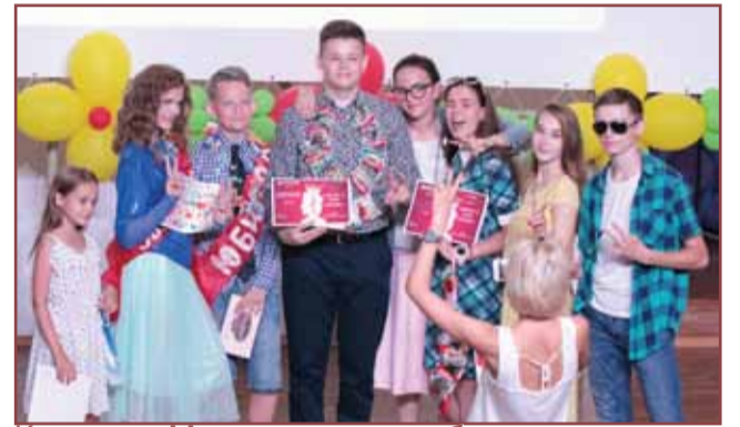
Конкурс «Мисс и мистер юбилея» и блиц-опрос для победившей пары страница 2-3